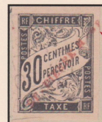
Copie agrandie du timbre montrant la variété de la position 2.

Le timbre présente la variété des lettres « o n » espacées, variété constante sur l'ensemble du tirage position 2 (voir page précédente).