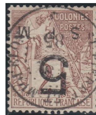
Daté de 1885 en noir, centrage exceptionnel.

La quasi-totalité des pièces est oblitérée par le cachet de Saint-Pierre, seuls deux exemplaires sont revêtus du rare cachet de Miquelon.