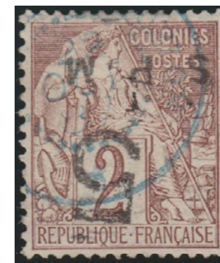
Daté de 1887 en bleu, centrage exceptionnel.