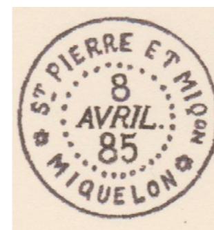
Cachet de Miquelon.