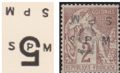
Double "SPM" tête-bêche. Le "SPM" à l'endroit, plus noir, provient d'un autre tirage. Neuf. Seule pièce connue.