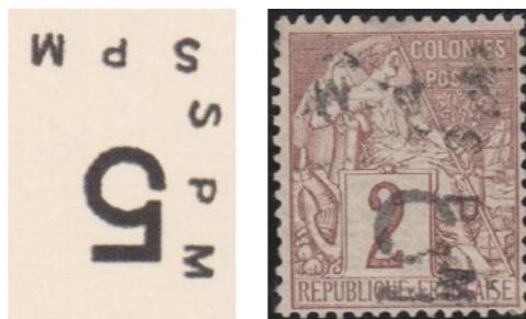
Double frappe "SPM" dont une verticale. Neuf. Seule pièce connue

Les deux variétés neuves avec les doubles frappes SPM sont réunies pour la première fois. Elles demeurent des raretés internationales.