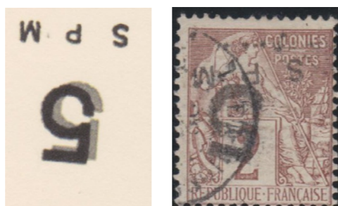
Double "5" superposé. Oblitéré. Deux pièces connues.