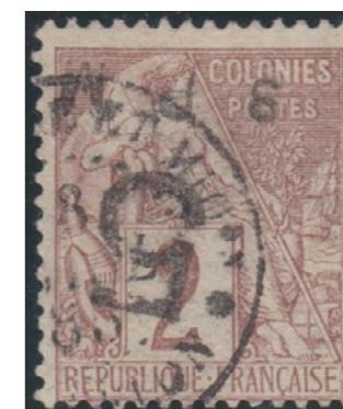
Cachet noir de 1885. Deux pièces connues