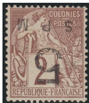
Frappes nettes et noires. SPM normal de 13.3mm. Très bon centrage. Début du 1er tirage.

Aucune indication exacte sur l'ensemble du tirage. Le nombre de timbres émis indiqué dans les ouvrages est flou. Cependant, une étude réalisée par l'auteur sur trente-cinq années, permet de certifier l'existence d'environ 120 exemplaires -incluant les variétés- dont 23 à l'état neuf. Les pièces neuves avec gomme et bien centrées sont rarissimes.