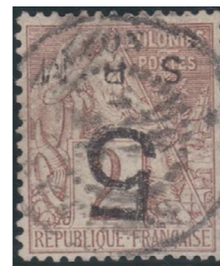
Cachet noir du 31 janvier 1885. Première date connue. Très bon tirage.