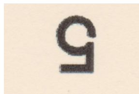
Le cachet manuel "5" frappait la surcharge à l'unité

Les timbres dentelés au type « Alphée Dubois » à 2c de couleur lilas-brun sur gris furent choisis pour recevoir deux frappes manuelles en noir :