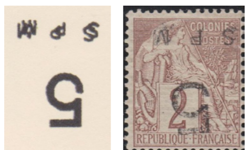
Surcharge "SPM" dédoublée. Neuf. Seule pièce connue. Rareté de colonies françaises

Catalogue spécialisé sur les classiques de SPM de 128 pages couleur.