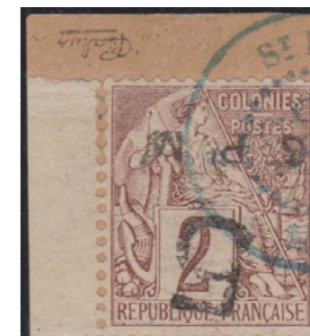
Oblitération de 1887. Seul exemplaire avec bord de feuille.