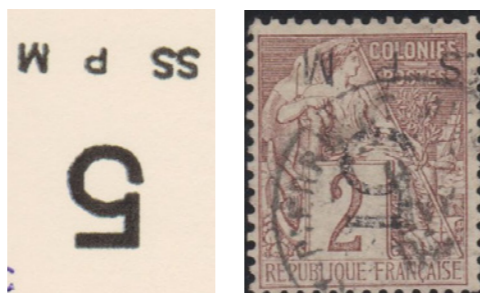
Double S "SSPM". Oblitéré. Seule pièce connue.