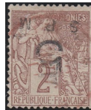
Daté de 1887 en rouge. La plus belle des trois pièces connues.