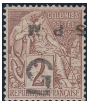
Frappes grises et empâtées. SPM normal de 13.3mm. Centrage exceptionnel. Fin du 1er tirage.