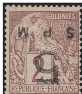
Frappes nettes et noires. SPM de 14mm. Arrondi du 5 cassé. 2ème tirage.

USAGE : Cette transformation à 5c était prévue pour l'affranchissement d'un pli local ou d'un imprimé adressé vers la France ou l'étranger (aucune pièce n'est connue à ce jour). La création du tarif local, par arrêté du 20 décembre 1875, fut mis en place le 1er janvier 1876.