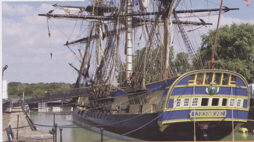
L'Hermione à quai

Quelle magnifique aventure collective depuis que, à Rochefort, le 7 septembre 2014, elle prit la mer pour la première fois avant d'aller mouiller dans la rade de l'île d'Aix. Que de milles parcourus depuis qu'elle a quitté la France le 18 avril 2015 pour rejoindre les lieux historiques de la côte est des États-Unis et du Canada, avant d'arriver à Saint-Pierre le 23 juillet. Le bouquet philatélique dédié à cet événement se compose :