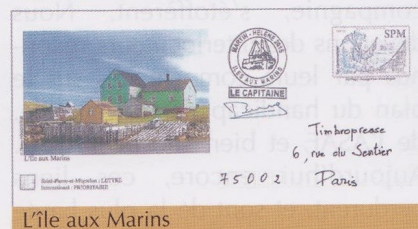
L'Île aux Marins

Là aussi, il s'agit d'une « renaissance », le service ayant débuté le 16 juin dernier pour 4 mois. À cette occasion, a été lancée par la Poste une opération philatélique consistant en un « prêt à poster » qui, marqué du tampon spécifique du Martin Hélène accompagné de la signature de son capitaine, recevra le cachet « Souvenir de l'Île aux Marins ».